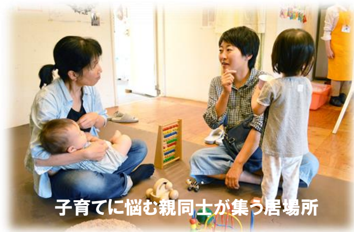
子育てに悩む親同士が集う居場所