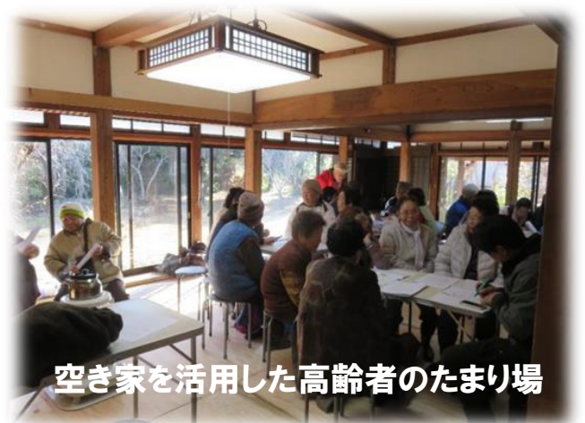
空き家を活用した高齢者のたまり場