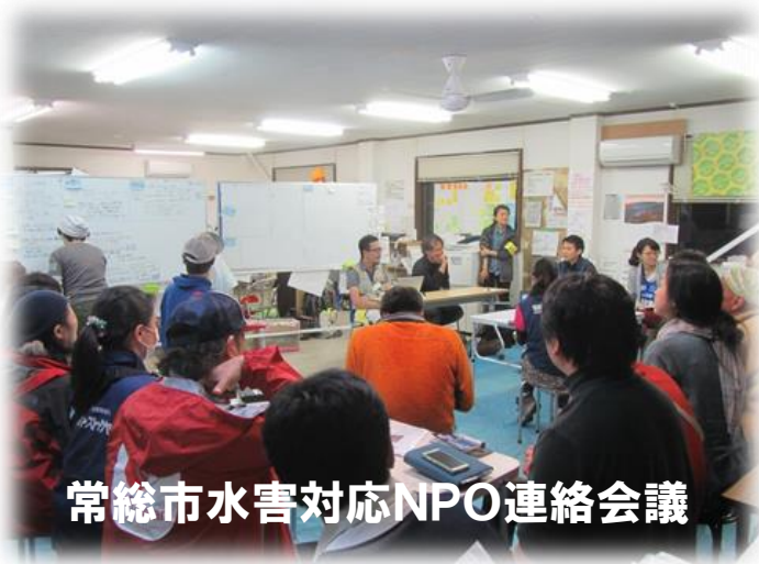
常総市水害対応NPO連絡会議