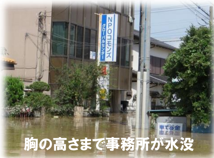
胸の高さまで事務所が水没

常総市に多い在住外国人の就労支援拠点、また外国人児童生徒の学習支援拠点として 2010 年頃から活動を続けてきた茨城 NPO センター・コモンスのグローバルセンターが被災しましたが、多くのボランティアの力によって復旧、整備され、様々な地域の助けあいを通じて復興へと向かう、たすけあいセンター「JUNTOS」という支援拠点に生まれ変わりました。「JUNTOS」はポルトガル語（常総市にはポルトガル語を話すブラジル人が多く在住）で「一緒に」を意味する言葉です。