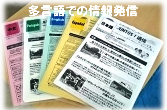
多言語での情報発信