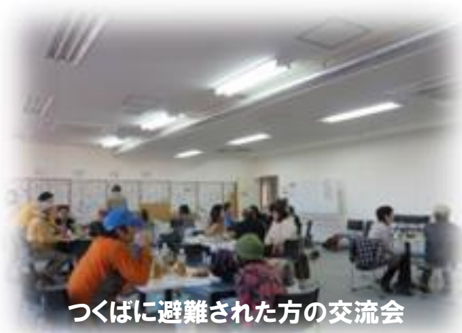
つくばに避難された方の交流会

常総から離れ、慣れないつくばでの生活を続けている被災者同士がつながる交流会を定期的に開催しています。また、被災者に対する支援制度の説明会を開催したり、相談対応を行いました。さらに、被災された方の声を集め、冊子などに編集し、被災者同士が想いを共有したり、被災経験を他の地域につなげる「ぬくもりのボタン」プロジェクトを実施しました。