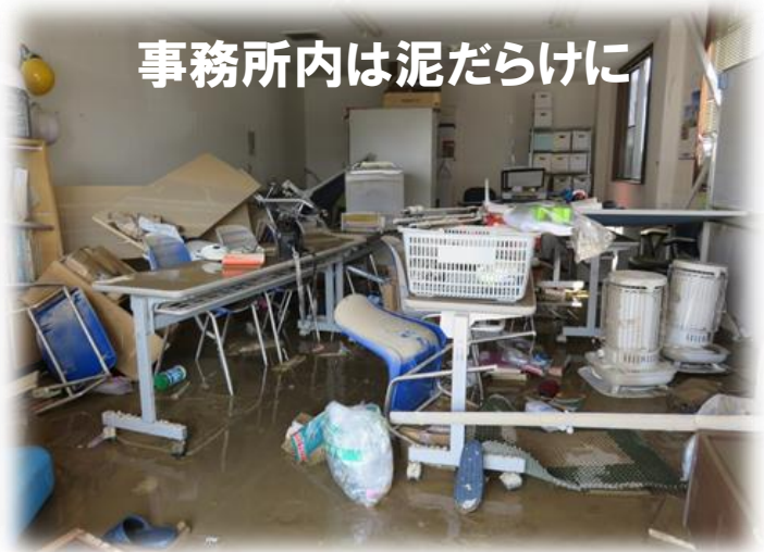
事務所内は泥だらけに