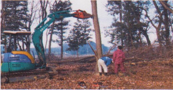
立ち枯れ木伐採(重機使用)